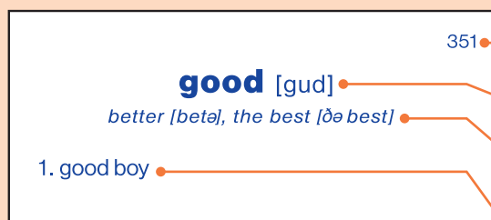
první – cizojazyčná – strana memokarty

Jednotlivé kartičky v jazykové sadě jsou uspořádány následujícím způsobem: